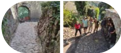
Élips - Chirols