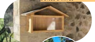
Boîtes à livres