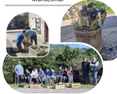
Éréa - Montélimar