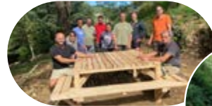
Tables de pique-nique